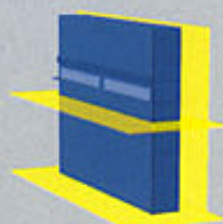
IPN kan installeras genom tak eller golv