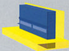
IPN nedsänkt i golvet