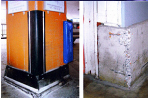
Skydd för hörn, pelare, portöppningar etc.