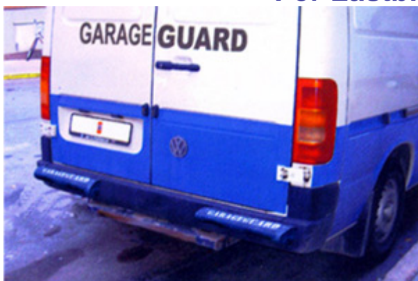
Påbackningsskydd med förarhyttslarm Skydd att montera på bilen med påkörningsindikator inne i förarhytten.