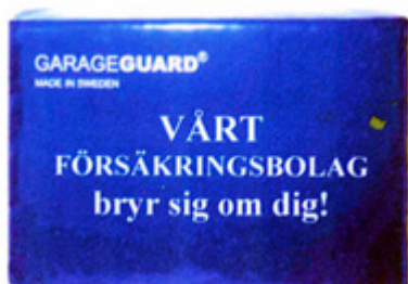
Framsidan är perfekt för reklam / informationstext