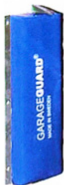
Hörnskydd Höjd 500 mm Tjocklek 60 mm